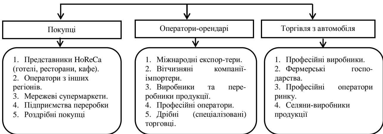
Рис. 2. Цільова аудиторія оптового ринку сільськогосподарської продукції

Оптова ціна на оптовому ринку сільськогосподарської продукції включає всі витрати виробника, його прибуток, а також витрати, понесені сільськогосподарським виробником на ОРСП (маркетингові послуги ОРСП). Щоб отримати за продукцію більшу ціну, необхідно щоб вона мала відповідний товарний вигляд. Виробникам ОРСП це допоможе не тільки зберегти товар, а й підготувати його до продажу: наприклад, картоплю прокалібрувати, очистити, розфасувати, упакувати тощо. Тобто, оптовий ринок різко підвищує доступність сільгоспвиробників безпосередньо до оптових покупців і, тим самим, може суттєво вплинути на збільшення їхніх доходів (рис. 2).