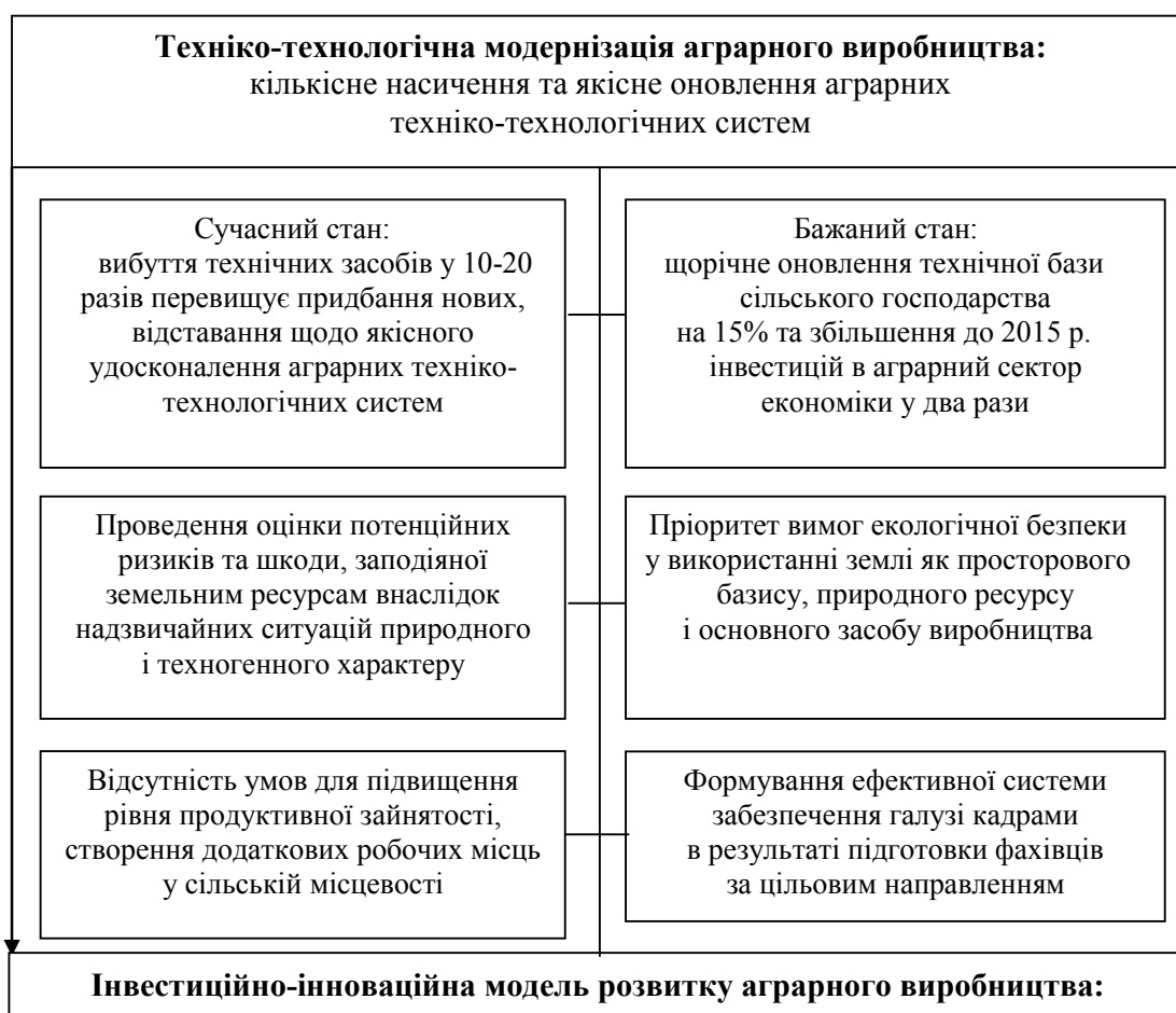
Рис. 1. Узгодження модернізації аграрних техніко-технологічних систем із вимогами інвестиційно-інноваційної моделі