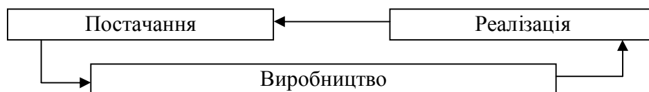
Рис. 1. Кругооборот капіталу

Для ілюстрації кругообороту капіталу використовується модель, запропонована К. Марксом в праці «Капітал»[13], яку можна представити формулою \Gamma - T - T' - \Gamma' або графічно (рис. 1).