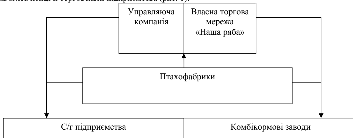
Рис. 1. Існуюча організаційно-інтегрована структура ЗАТ «Миронівський хлібопродукт»

Важливим критерієм розвитку виробничо-економічних відносин може виступати ступінь узгодженості дій між учасниками відтворювального процесу. В сучасних умовах, враховуючи монопольний характер розподільних відносин в АПК, існування ситуації взаємного врахування міжгалузевих інтересів знаходиться під великим питанням. Виходячи з цього, у рамках відтворювального процесу розвиток птахівничих підприємств потребує інвестиційного стимулювання, яке може проводитися в рамках ЗАТ «Миронівський хлібопродукт», що включає виробника комбікормів, виробника та переробника м'яса птиці й торговельні підприємства (рис. 1).