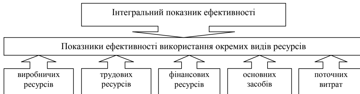
Рис. 2. Система показників ефективності

Грунтуючись на викладеному, схематично систему показників ефективності можна зобразити як представлено на рис. 2.