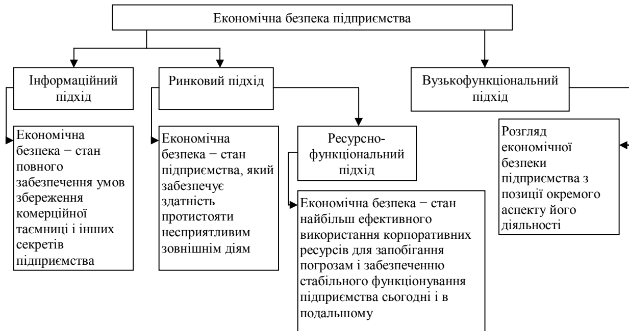
Рис. 1. Підходи щодо визначення поняття «економічна безпека підприємства»

Виклад основного матеріалу дослідження. Можна виділити чотири основних підходи щодо визначення економічної безпеки підприємства (рис. 1.).