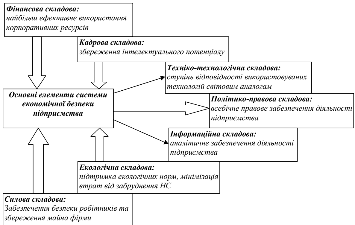
Рис. 2. Основні елементи системи економічної безпеки підприємства

Для цього нами запропонована "тримірна діагностика рівня економічної безпеки підприємства", – вперше розглянута Довбнею С. Б. та Гічовою Н. Ю. [3, 91], що є комплексним методичним підходом до визначення економічної стійкості підприємства залежно від трьох основних параметрів: поточної, тактичної і стратегічної економічної безпеки (рис. 3.).