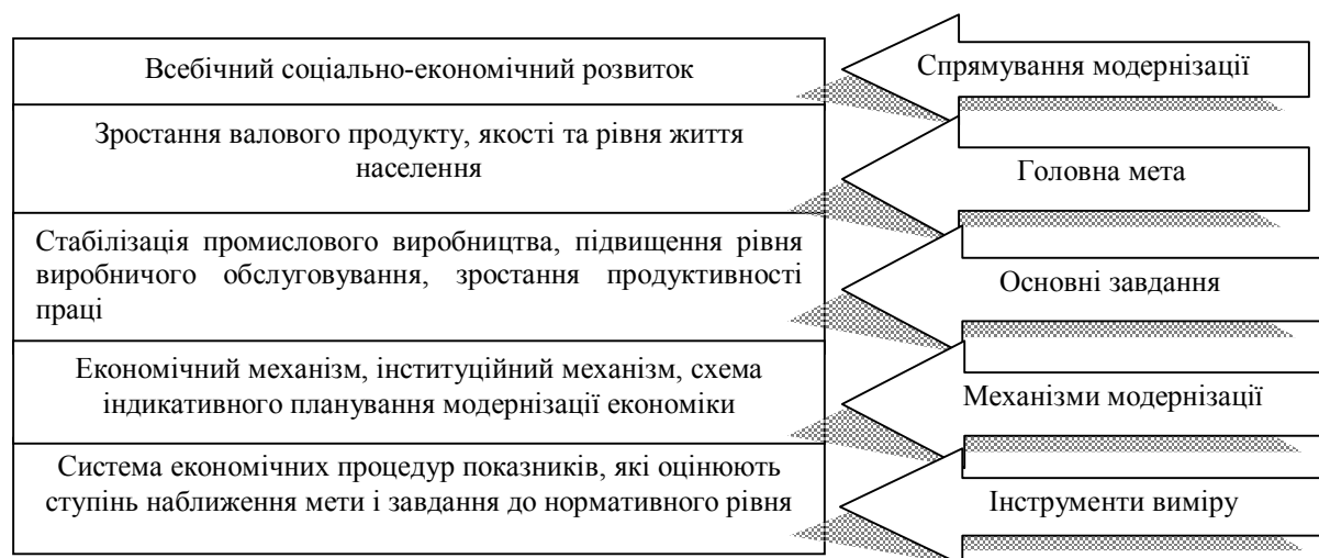
Рис. 1. Процесний аспект модернізації економіки [14]

Перші чотири групи факторів є базовими, оскільки саме вони визначають можливості економічного росту в країні. Ще одним важливим фактором, що зумовлює можливості модернізації, є стан, використання та структура економічного потенціалу, проаналізувати які можливо за допомогою таких індикаторів, як динаміка національного ВВП і його частка у світовому ВВП, відтворювальна і галузева структура національної економіки.