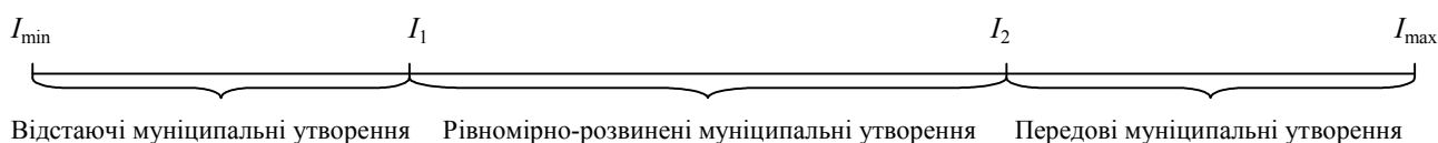
Рис. 2. Групи муніципальних утворень за рівнем їх соціально-економічного розвитку*:

6. Визначення груп муніципальних утворень регіону по рівнях їх розвитку. На підставі отриманих інтегральних кількісних рейтингів можна виділити наступні групи муніципальних утворень регіону (рис. 2).