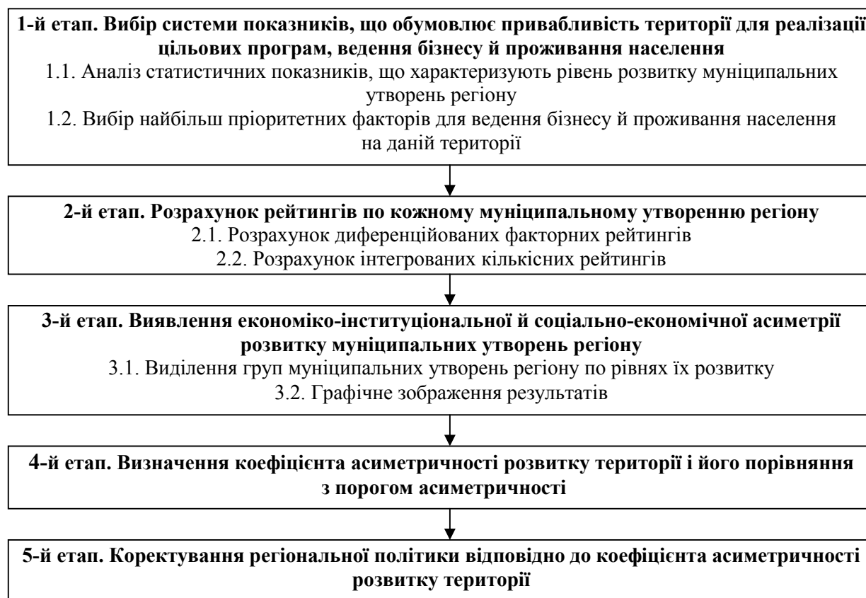
Рис. 1. Етапи методики оцінювання рівня асиметрії муніципальних утворень регіону

Методика оцінювання рівня асиметрії муніципального утворення регіону для органів влади, бізнесу й для населення включає етапи, зображені на рис. 1.