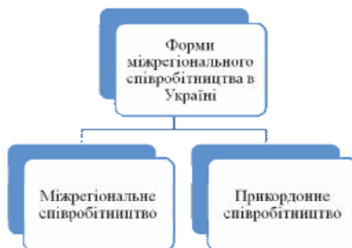
Рис. 2. Форми міжрегіонального співробітництва в Україні

регіону та фінансових потоків на території базування. Великі масові промислові виробництва – центр такого регіону [7, с. 38].