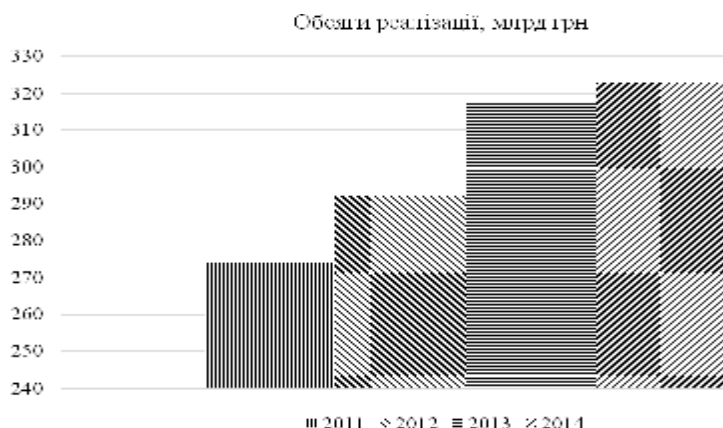
Рис. 1. Динаміка обсягів реалізації підприємствами сфери послуг за період 2011 – 2014 рр., млрд. грн.*