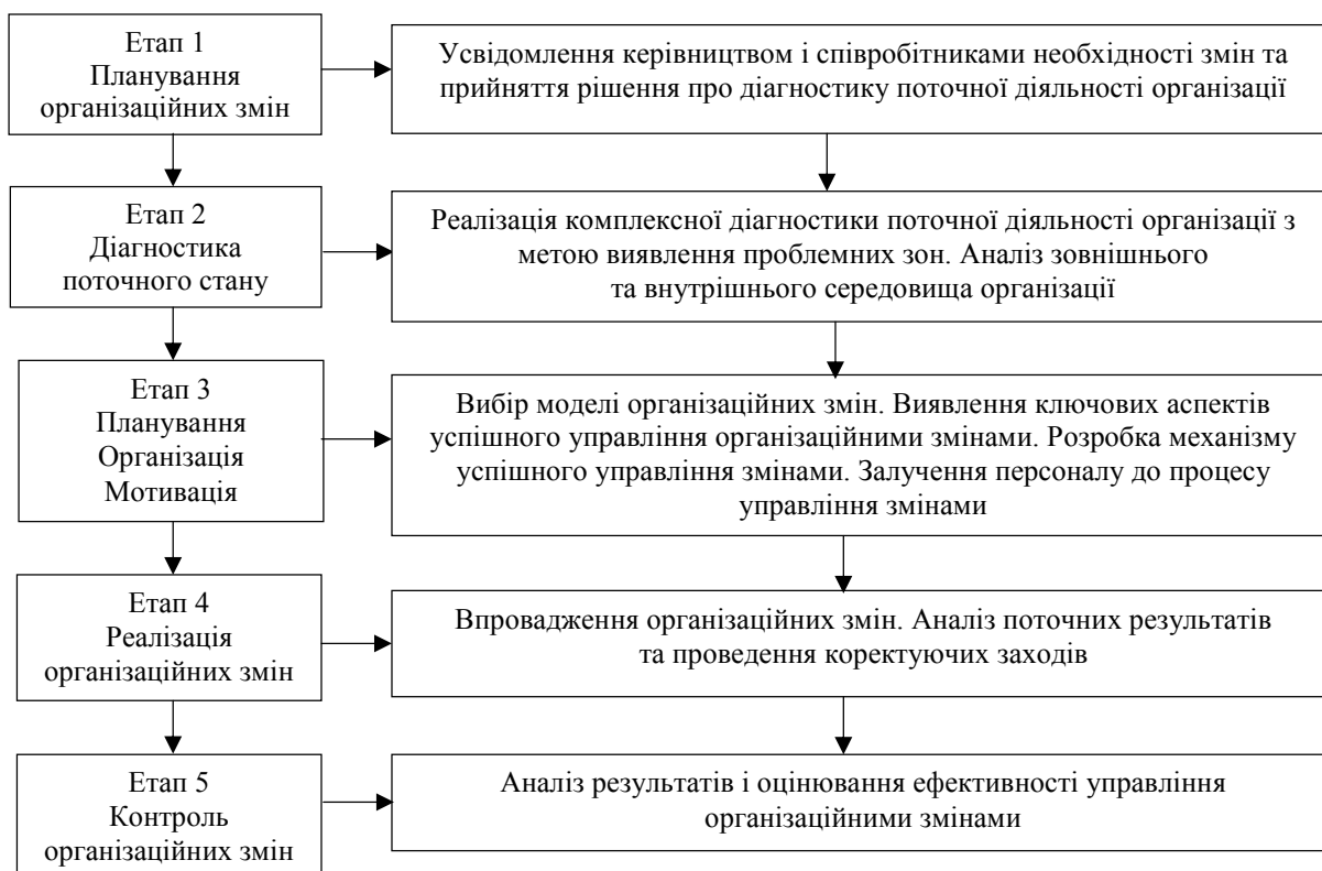
Рис. 2. Схема впровадження організаційних змін на підприємстві

Враховуючи усе вищенаведене, пропонується схема впровадження організаційних змін на підприємстві (рис. 2).