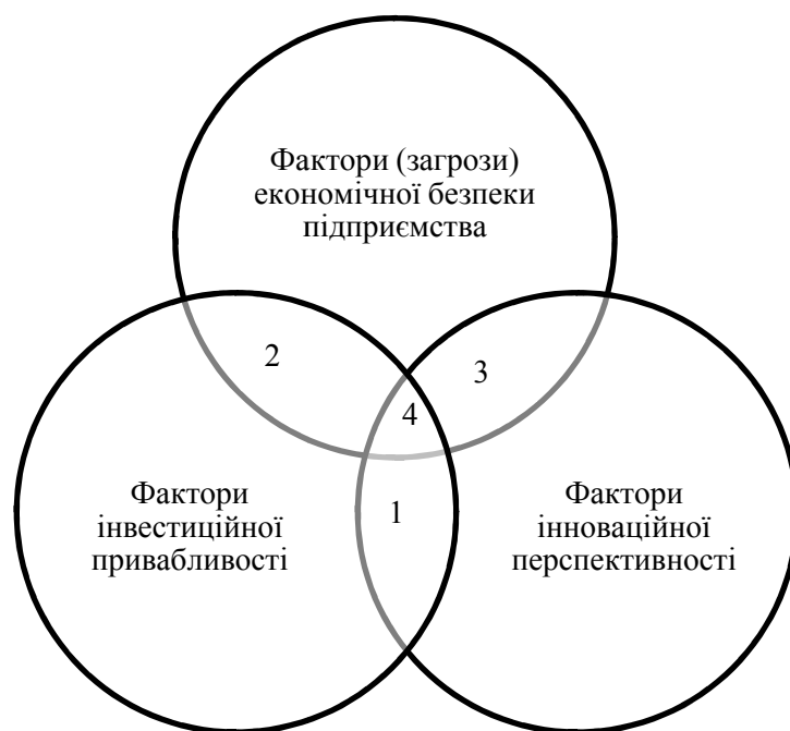
Рис. 1. Спільні зовнішні фактори формування рівня економічної безпеки, інноваційного потенціалу та інвестиційної привабливості підприємства

Оцінювання інвестиційних можливостей підприємства та оцінювання рівня його економічної безпеки тісно взаємопов'язані та мають ряд спільних ознак. Зокрема, зовнішні фактори впливу, на нашу думку, є в цілому аналогічними. Узагальнюючи окреслені фактори зовнішнього впливу на інвестиційну привабливість, інноваційну перспективність та рівень економічної безпеки, можемо виявити ті з них, що є спільними для означених характеристик підприємства (рис. 1).