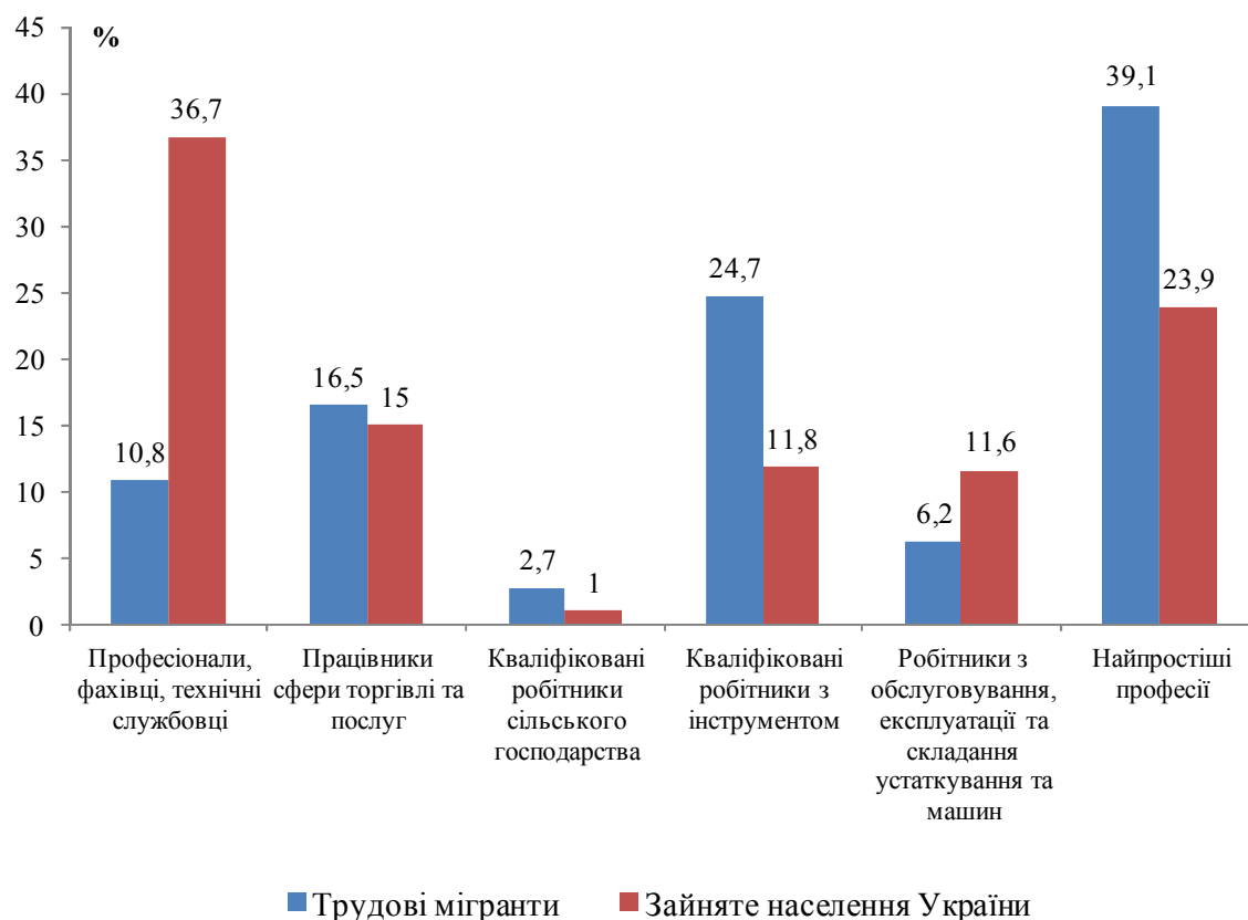
Рис. 2. Трудові мігранти та зайняте населення України за професійними групами [8]

дових мігрантів у країні Вишеградської четвірки та ЄС, більш тривале перебування мігрантів у країні призначення, формалізація статусу вже наявних мігрантів, об'єднання сімей, а також можливе зростання неофіційної зайнятості. Оскільки візова лібералізація не мала суттєвого впливу на довгострокові міграційні тенденції у таких різних випадках, як у Польщі, Балтійських країнах, Румунії та Болгарії, а пізніше в Сербії, Чорногорії, Македонії, Албанії та Боснії і Герцеговині, буде дивним очікувати суттєво інших тенденцій у випадку України. Якісні характеристики майбутніх мігрантів з України, найвірогідніше, стануть більш різноманітними. Залишиться поширеною поточна циркулярна міграція, яка часто пов'язана із сезонною низькокваліфікованою роботою. Одночасно постійна міграція може збільшитись, включно із об'єднанням сімей та міграцією для отримання освіти. Таким чином, нелегальна міграція, яка найчастіше пов'язана із сезонною і низькооплачуваною роботою в емігрантських нішах, може скоротитись [9].