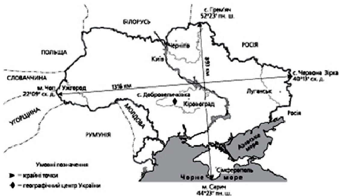
Рис. 1. Крайні точки та географічний центр України

Довжина державного кордону України становить 7700 км, рис. 1. Кордон простягається по суходолу 5740 км і морях 1960 км. 1560 км морського кордону припадає на Чорне море і 400 км – на Азовське. За протяжністю державного кордону Україна посідає одне з перших місць у Європі. Держава безпосередньо межує з сімома країнами – Російською Федерацією, Білоруссю, Молдовою, Румунією, Польщею, Угорщиною і Словаччиною. Найдовшими є кордони з Російською Федерацією (2063 км), Молдовою (1191 км) і Білоруссю (1084 км). Довжина кордону України з Румунією становить 625 км, Польщею – 543 км, Угорщиною – 135 км, Словаччиною – 99 км. Через Чорне море Україна має спільні кордони з Туреччиною, Болгарією і Грузією.