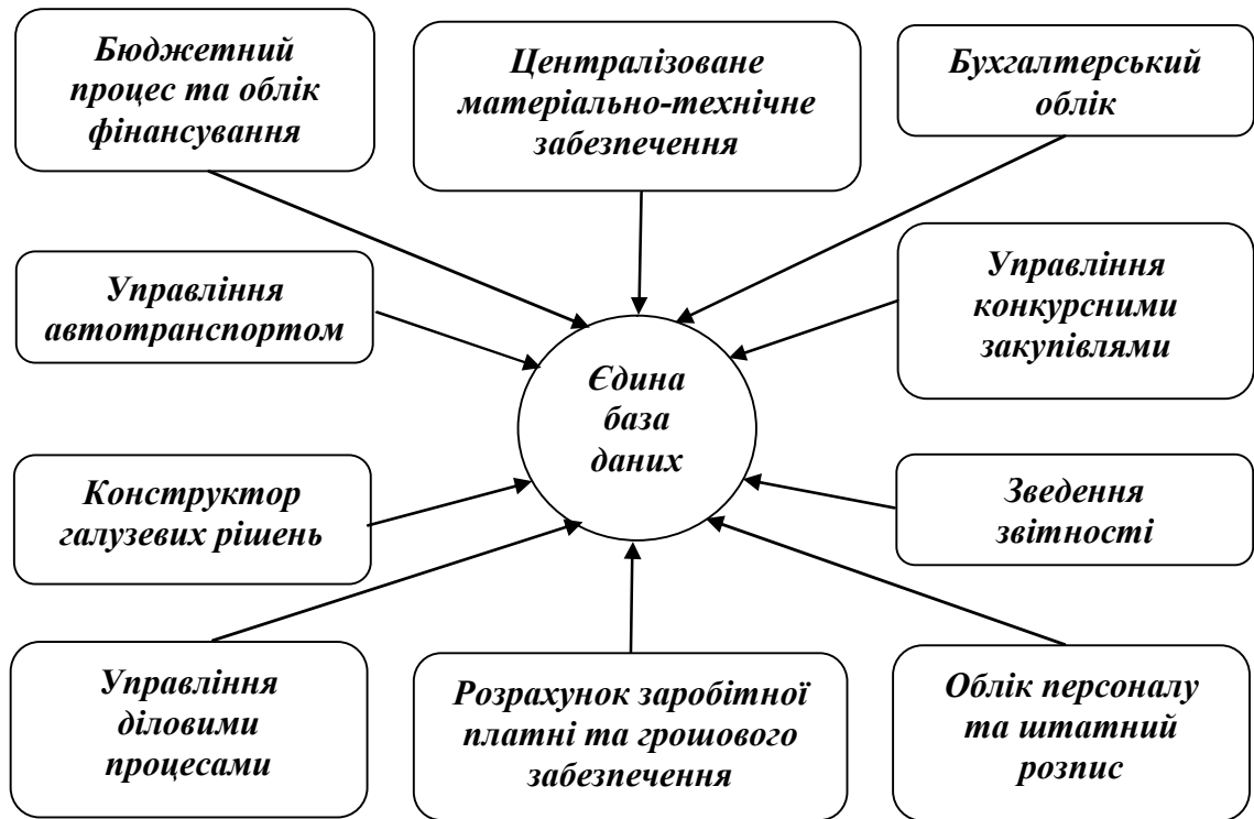
Рис. 1. Склад системи автоматизації ведення бухгалтерського обліку в фінансових органах ЗС України “Парус – Бюджетна установа 8”.

За допомогою системи “Парус” у Міністерстві оборони (МО) автоматизовані наступні фінансові процеси: