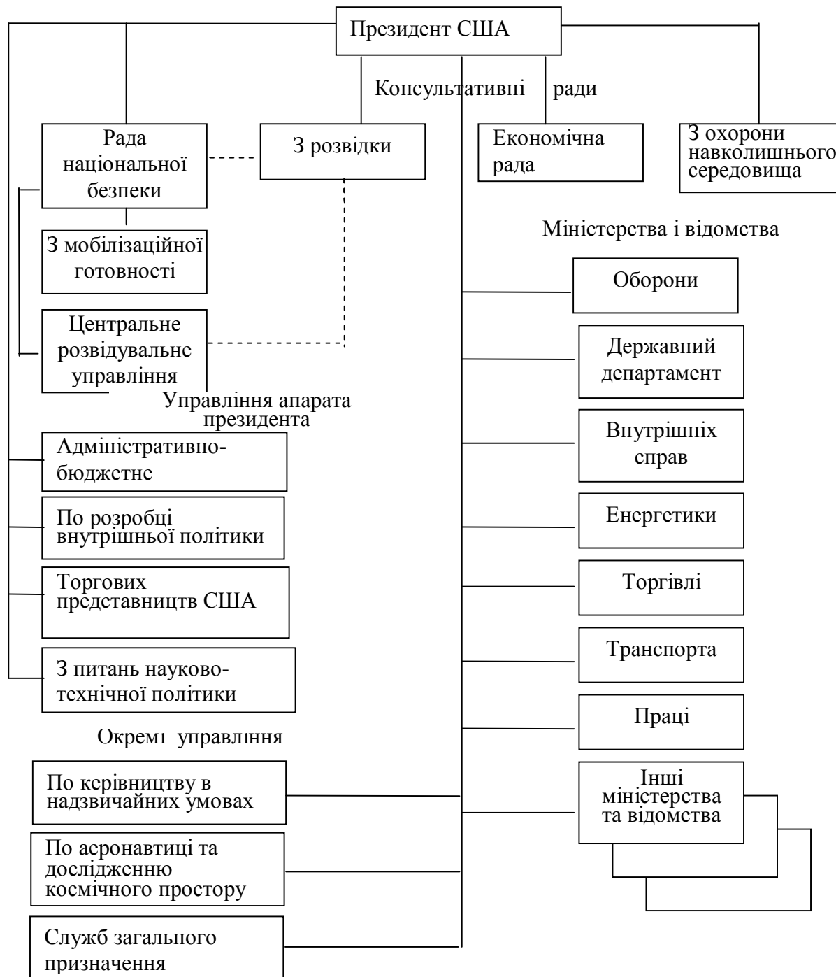
Рис. 1. Виконавчі органи, що приймають участь у підготовці воєнної промисловості до мобілізаційного розгортання

оборони виробляє рішення по кардинальних питаннях підготовки до війни, у тому числі й мобілізаційному розгортанню воєнної промисловості. У центральному апараті міністерства оборони питаннями підготовки воєнної промисловості до мобілізаційного розгортання займаються управління заступників і помічників міністра.