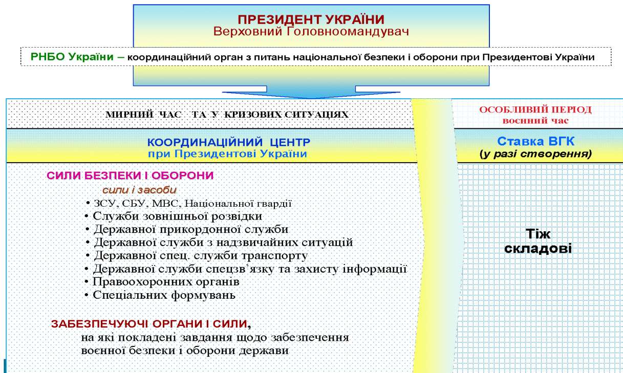
Рис. 2. Авторський варіант консолідації державного управління сектором безпеки і оборони України

України (п. 4.2). Варіант такої консолідованої системи управління наведений на рис. 2.