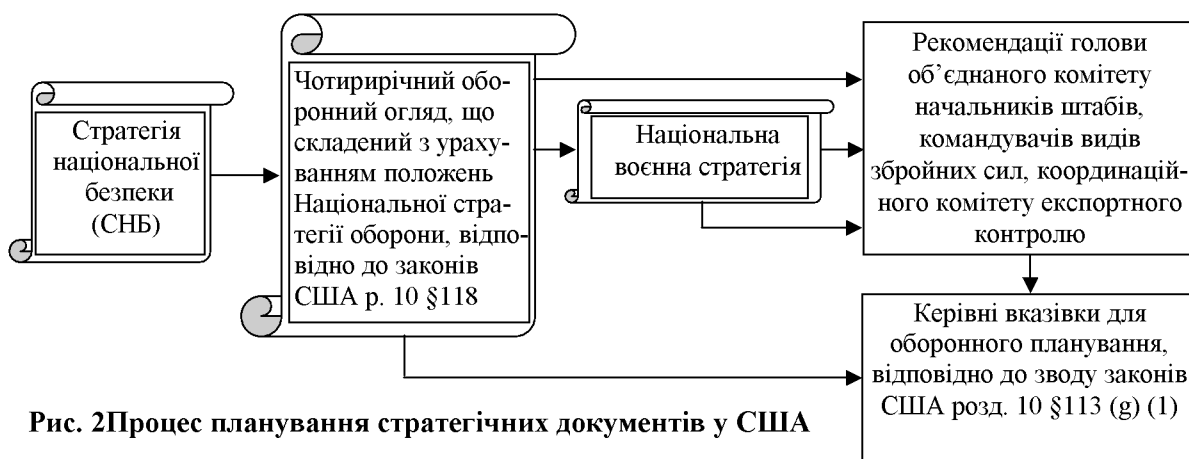
Рис. 2 Процес планування стратегічних документів у США

Закон США “Щодо планування національної оборони на рік” має розділи які визначають: роль США у світі, національні інтереси та цілі, оборонну стратегію, парадигму процесу планування сил, глобальну військову присутність США, створення військової структури США ХХІ сторіччя, ефективність роботи міністерства оборони, управління ризиками. Окремий розділ присвячений заяві голові Об’єднаного комітету начальників штабів збройних сил США.