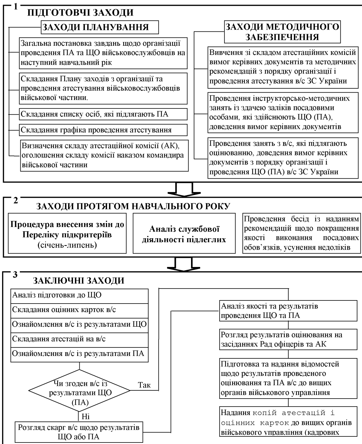
Рис. 1. Алгоритм діяльності кадрових органів щодо проведення ЩО (ПА)

Заключні заходи (блок 3) проводяться з жовтня по грудень наступного року. Відповідальними виконавцями заклочних заходів є: безпосередній командир (начальник) і посадові особи, які беруть участь у щорічному оцінюванні та періодичному атестуванні; начальник кадрового органу; керівний склад військових частин і Голови Рад офіцерів та атестаційних комісій.