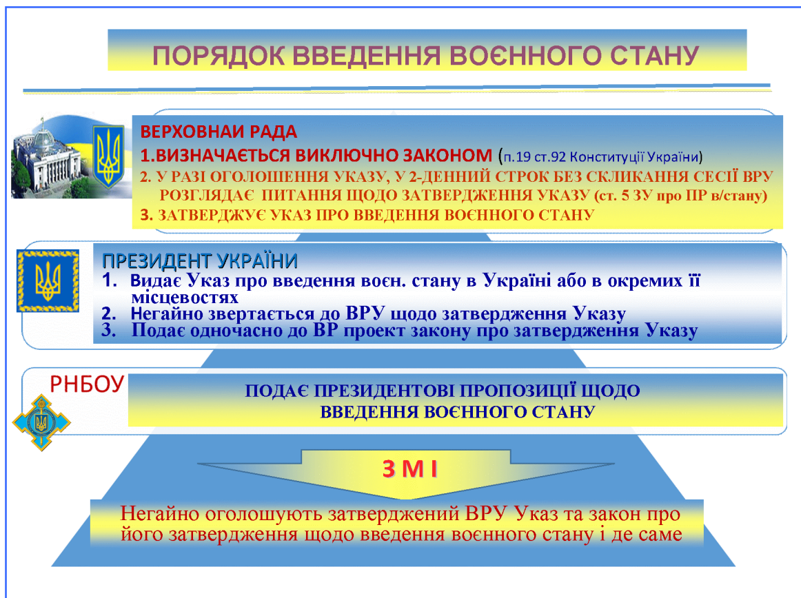
Рис. 2. Схема введення особливого правового режиму воєнного стану

“Стан війни” аж ніяк не можна плутати з “воєнним станом”, тобто з особливим правовим режимом . Такий режим може бути введений в Україні або в окремих її місцевостях лише в порядку, визначеному п. 19 ст. 92 Конституції України та відповідним Законом України (рис. 2).