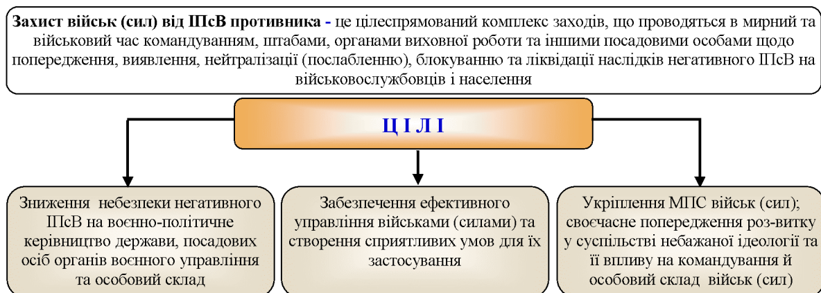
Рис. 1. Цілі захисту військ від ПСВ

своєчасного запобігання розвитку у військових колективах небажаної ідеології та її впливу на командування і особовий склад частини (підрозділу).