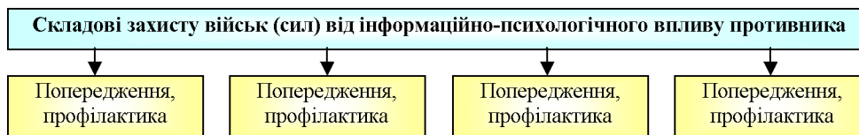
Рис. 2. Структура (складові) захисту військ від негативного ІПСВ

За своєю структурою захист військ (сил) від ІПСВ противника передбачає такі кроки: прогнозування; запобігання (попередження та профілактика); зрив (нейтралізація) та ліквідація наслідків реалізації негативного інформаційно-психологічного впливу (рис. 2, рис. 3).