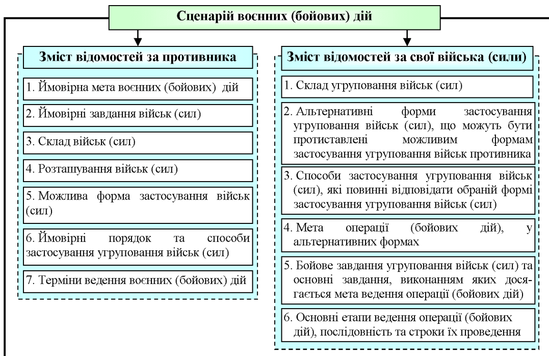
Рис. 2. Структура та зміст сценарію воєнних (бойових) дій (варіант)

уточнення бойового складу угруповання військ (сил).