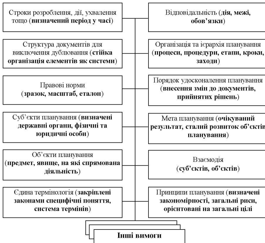
Рис. 2. Сукупність основних вимог до системи документів стратегічного планування розвитку спроможностей Збройних Сил України та інших складових сил оборони

За результатами проведеного дослідження сформовано сукупність основних вимог до системи документів СПРС ЗС України та ІССО (рис. 2).