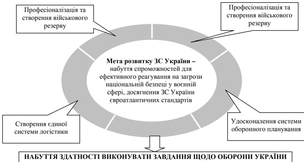
Рис. 1. Стратегічні цілі розвитку Збройних Сил України

Так, у СОБ визначено стратегічні й оперативні цілі оборонної реформи та шляхи їх досягнення. Зокрема, щодо збільшення спроможностей сил оборони до рівня, що дасть змогу забезпечити виконання завдань оборони держави і відновлення її територіальної цілісності, активізації участі в реалізації Спільної безпекової і оборонної політики Європейського Союзу та активне співробітництво з НАТО з досягненням критеріїв, необхідних для набуття повноправного членства в Організації Північноатлантичного договору [1]. Однією з представлених у СОБ стратегічних цілей розвитку Збройних Сил України, наведених на рис. 1, є “Професіоналізація та створення необхідного військового резерву ЗСУ”.