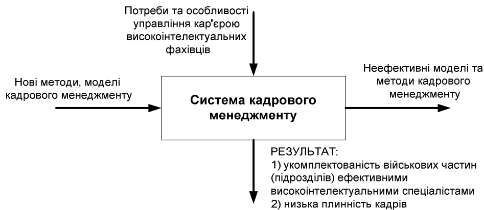
Рис. 1. Інноваційна система кадрового менеджменту

організація інноваційної діяльності персоналу – реалізує встановлення взаємозв'язків і розподіл функцій між спеціалістами, надання прав і встановлення відповідальності між ними, також вона полягає в періодичному або безперервному порівнянні фактично отриманих результатів інноваційної діяльності із запланованими, і наступному їх коригуванню.