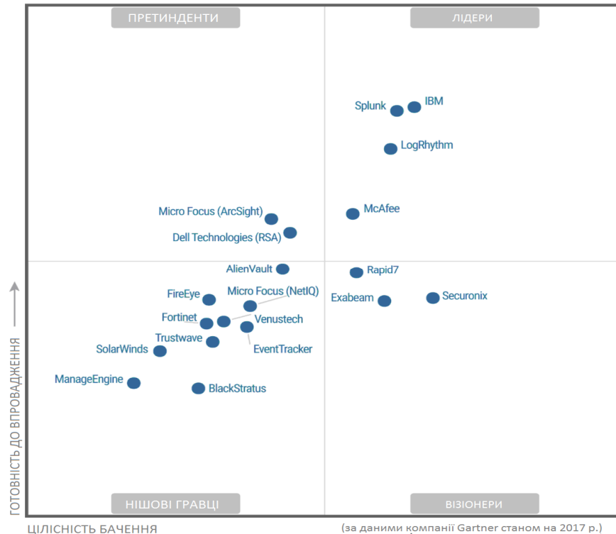
Рис. 3. Рейтингування програмних платформ управління інформаційною безпекою та подіями безпеки за методологією Gartner

На рис. 3 наведений, так званий, магічний квадрант Гартнера (Gartner's Magic Quadrant), який відображає ступінь задоволення зазначених вимог.