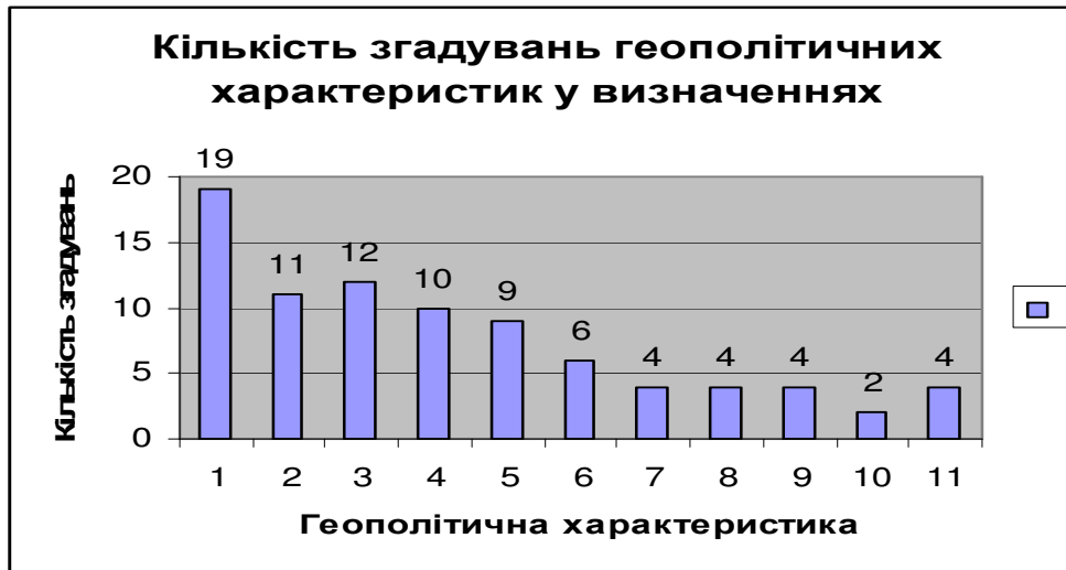
Рис. 1. Кількість згадувань геополітичних характеристик у визначеннях

Х. Моргентау, визначаючи національну силу держави, виокремив дев'ять характеристик: географічне положення, природні ресурси, промислові можливості, військова підготовленість, чисельність населення, національний характер, національна мораль, якість дипломатії, якість уряду.