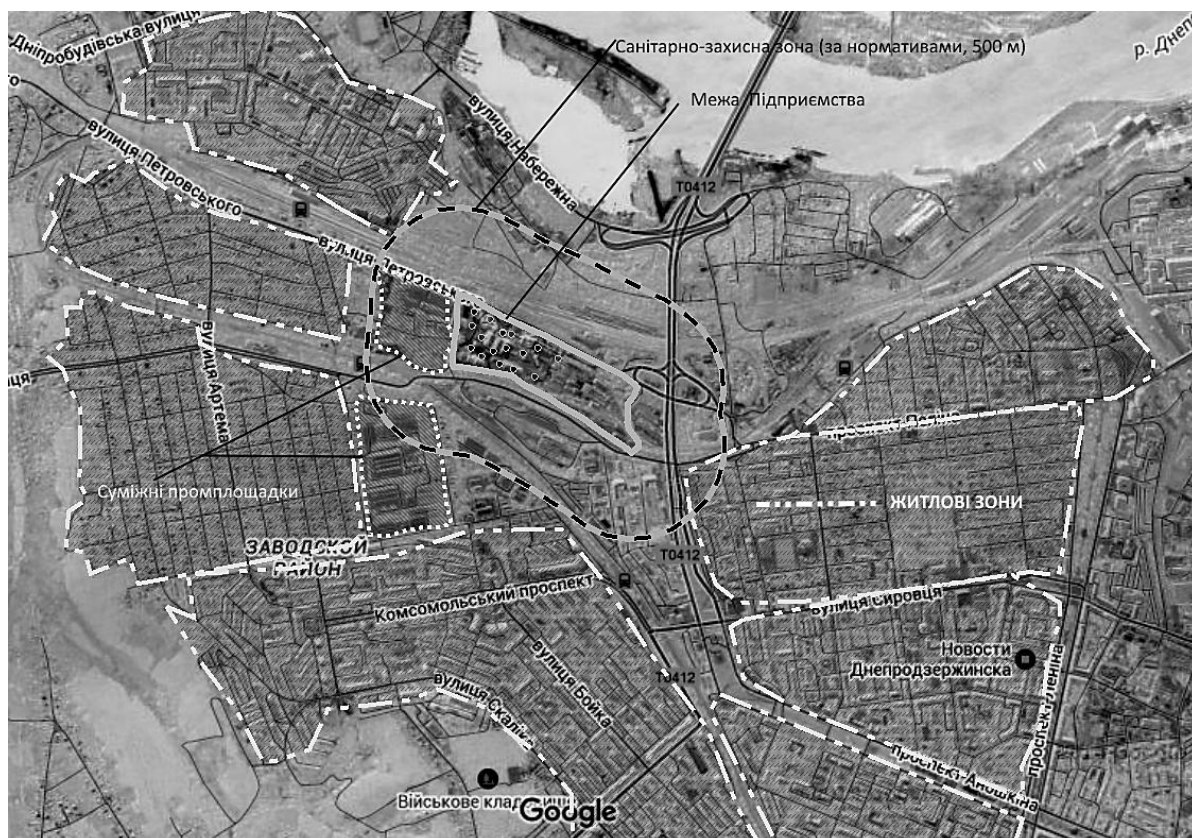
Рисунок 2 – Зона дослідження

Розташування меж промислового майданчика ХЦУ та суміжних житлових та промислових зон показано на рис.2. Відповідно до II класу небезпечності промислового об'єкта побудовано нормативну СЗЗ (500 м від меж підприємства).