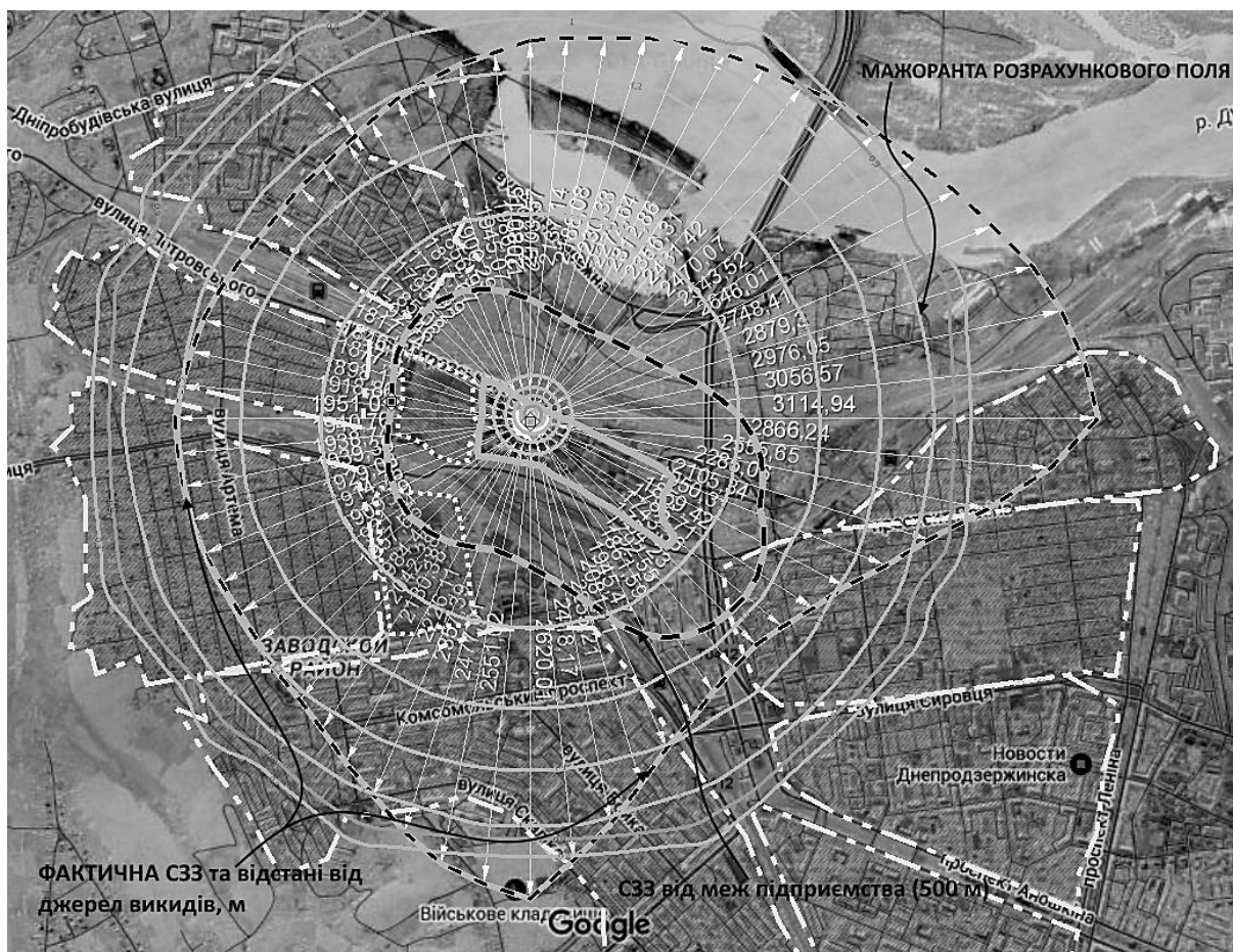
Рисунок 5 – Фактична СЗЗ з урахуванням рельєфу та кліматичних умов січня

Для умов січня мапа забруднень поширюється на більшість житлових зон центральної частини міста, на усі напрямки, виходячи далеко за 500 м від СЗЗ підприємства та розповсюджуючись на відстань до 2 км, а на сході – до 3 та більше км, на півдні – більше, ніж на 2,5 км (рис.5).