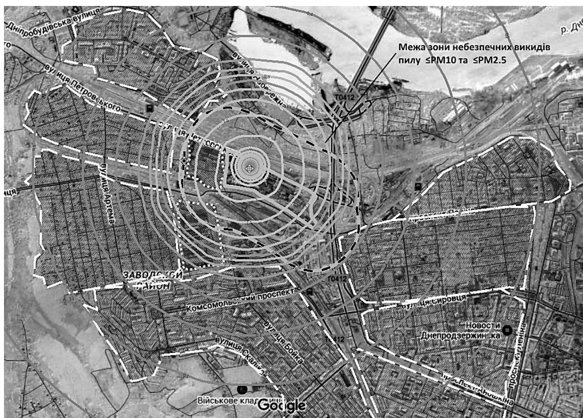
Рисунок 3 – Розрахункові зони викидів пилу