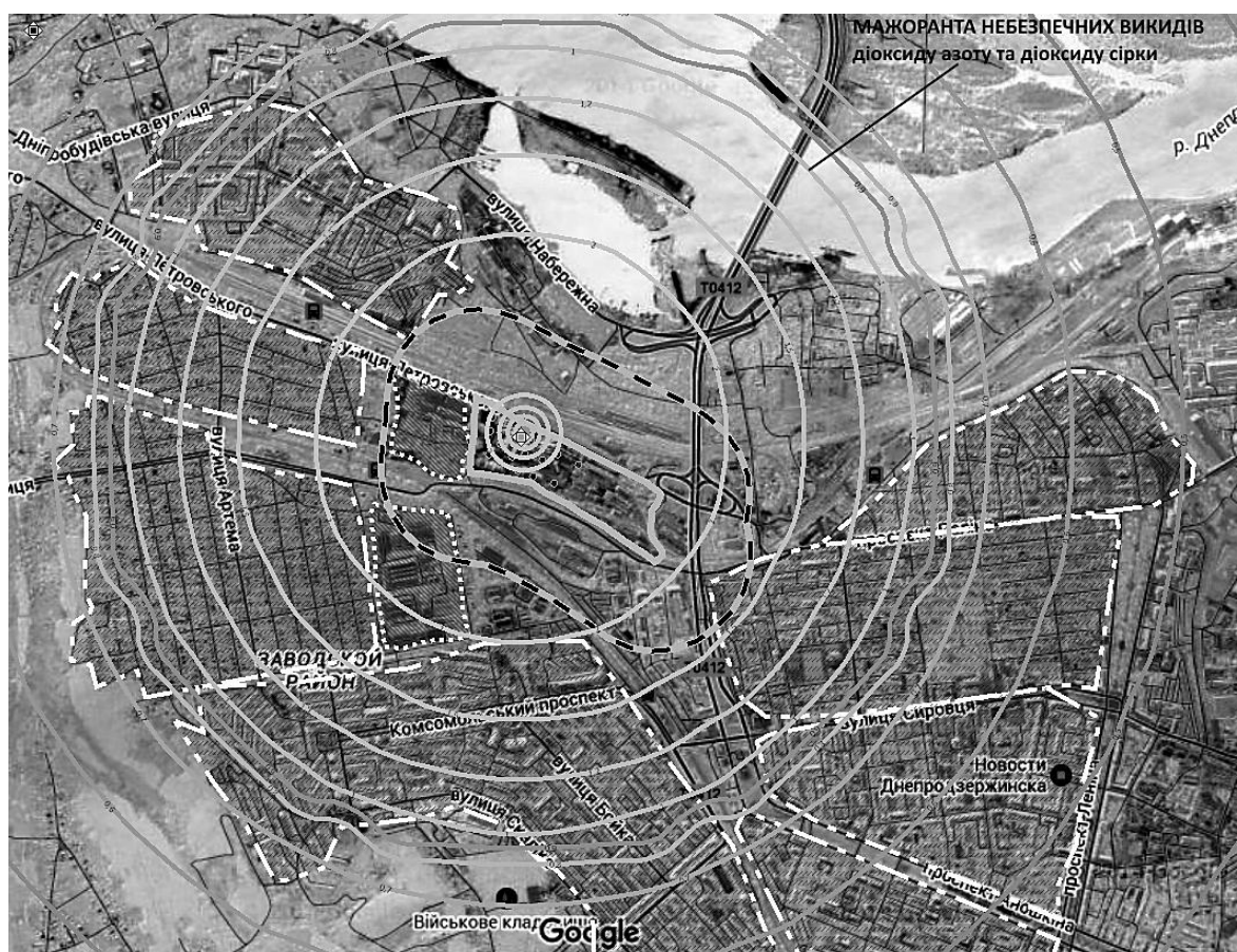
Рисунок 4 – Розрахункові зони викидів діоксиду азоту та діоксиду сірки