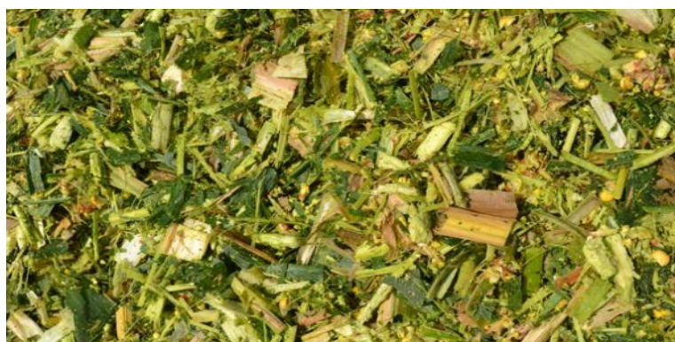
Рисунок 2 – Подрібнений рослинний матеріал амброзії, полину та подорожнику

Силосування проводили протягом 7 діб. Час силосування визначався такими параметрами, як ступенем подрібненості матеріалу, періодичністю перемішування культуральної рідини при підтримці температури на рівні 45°C. рН в свою чергу становив від 3,5 до 4,3 за рахунок кислоти, яка виділяється культурою. Загальний вигляд рослинного матеріалу після подрібнення представлено на рис.2.