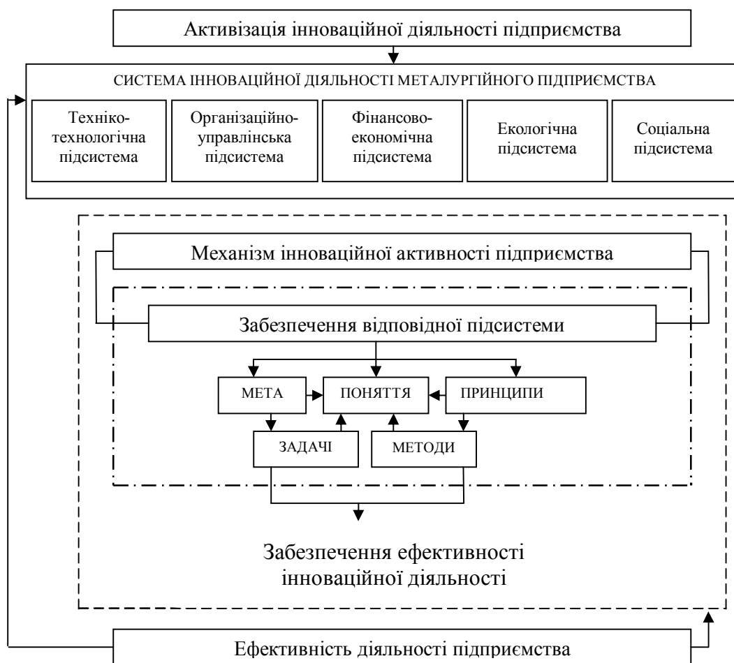
Рисунок 1 – Складові елементи забезпечення механізму активізації інноваційної діяльності металургійного підприємства

На сьогоднішній день в економічній літературі не існує єдиного підходу до тлумачення категорії «інноваційна активність підприємства», між вченими та дослідниками немає повного консенсусу, що потребує подальшого дослідження й систематизації.