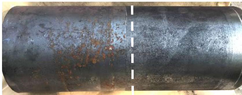
Рисунок 1 - Образец трубы с поверхностью до (а) и после (б) ППД

Для оценки коррозионной стойкости наружной поверхности образцов, подвергнутых ППД без применения и с применением ингибиторов коррозии, в Научно-исследовательском центре «Качество» (г. Днепр, Украина) были проведены 3 вида исследований, а именно: