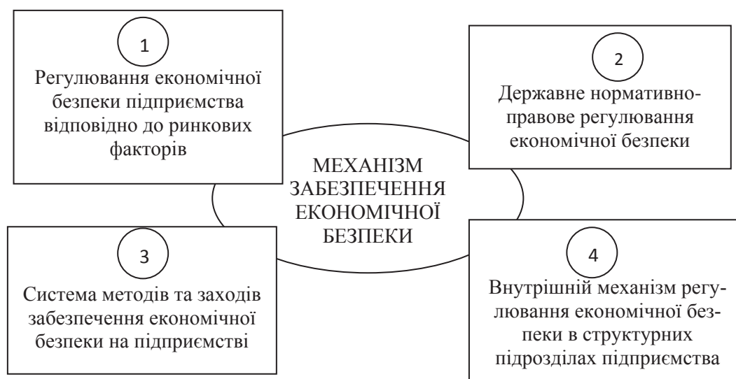
Рис. 1. Основні елементи механізму забезпечення економічної безпеки підприємства

Таким чином, під механізмом управління економічною безпекою слід розуміти послідовність заходів з економічної безпеки, яка зумовлена сукупністю взаємозалежних елементів, що формують стан і зміст процесів, відповідно до визначених параметрів ефективності спрямованих на досягнення відповідного рівня. З вище означеного можна зробити висновок, що механізм управління економічної безпеки підприємства має такі характеристики: за природою інтересів і характером завдань він є організаційно-економічним; за рівнем функціонування – реалізується на рівні підприємства; за способом здійснення цілей – є механізмом змішаного управління, який об'єднує в собі самоуправління та управління ринковими структурами, також на нього впливають державні органи; за способом реалізації – є інструментом реалізації управління економічною безпекою (ЕБ) у динаміці; до складу механізму управління економічною безпекою підприємства входять внутрішня складова управління (управління ЕБ підприємства і внутрішні фактори впливу на нього) та зовнішня складова регулювання (зовнішні фактори впливу на ЕБ).