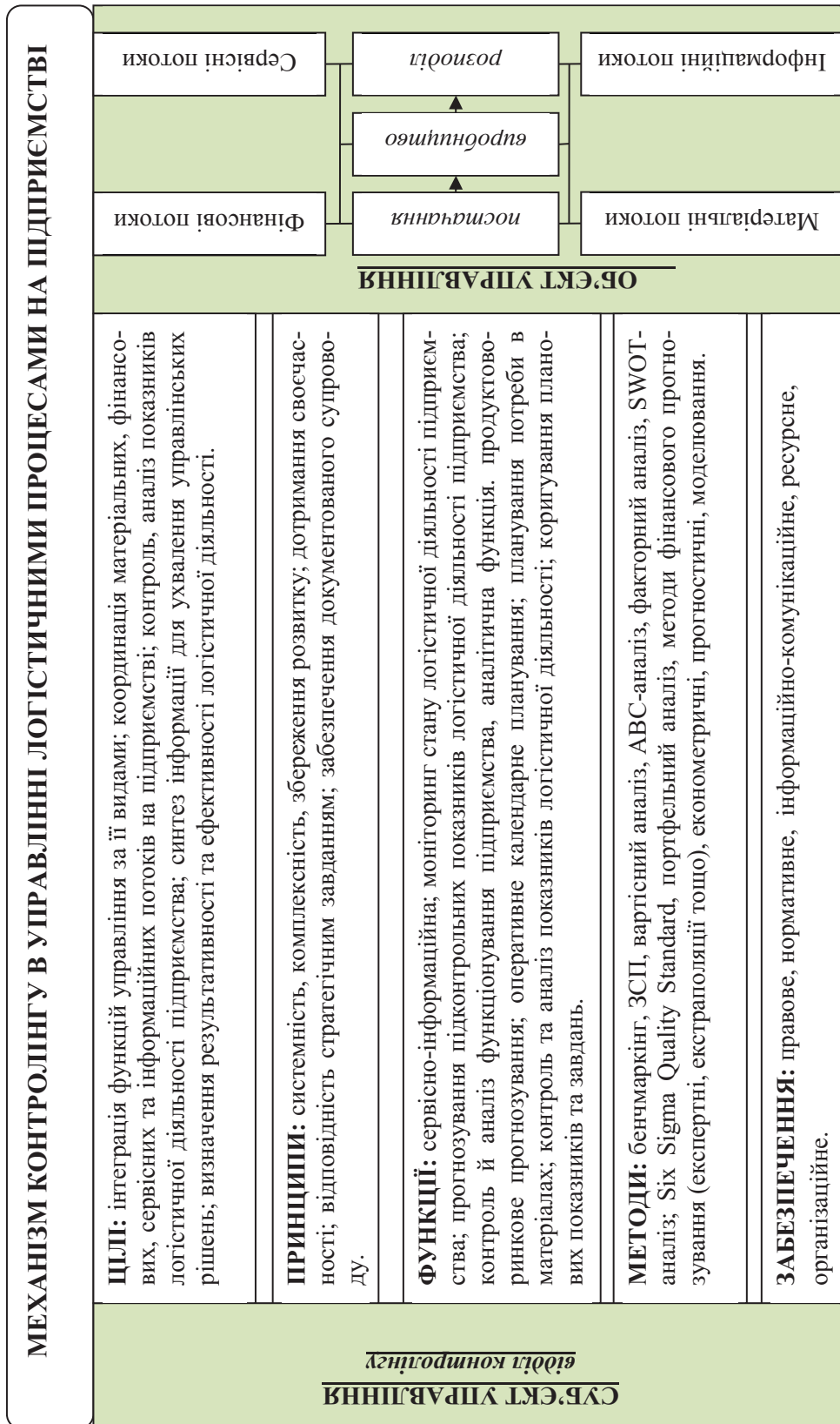
Рис. 2. Механізм контролінгу в управлінні логістичними процесами на підприємстві