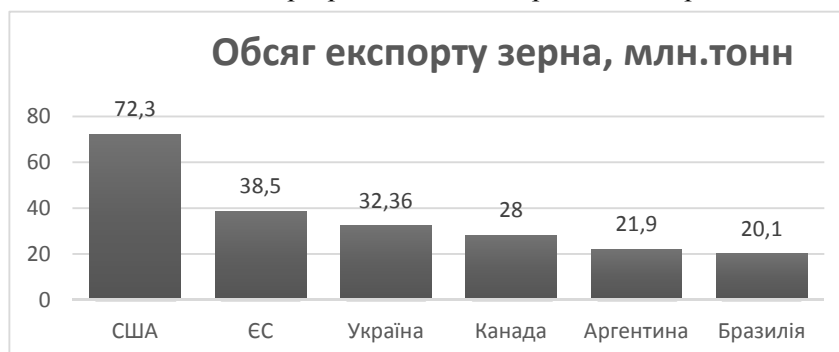
Рис. 1. Обсяг експорту зерна України

Процес реалізації зернових, в тому числі на експорт, характеризується неодноразовим перепродажем після придбання його безпосередньо у виробника. У такий спосіб, з одного боку, відбувається послідовне підвищення ціни на сировину і виробу з неї, а з іншого – спостерігається зниження ціни виробника, що, безумовно, є негативним фактором розвитку вітчизняного ринку зернових. У зв'язку з економічною кризою у світовій і вітчизняній економіці Україна протягом останніх років скоротила показники з обсягів експорту та імпорту. Але вона посіла третє місце в світі з експорту зернових в 2013/2014 МР (рис. 1). При цьому Україна випередила таких традиційно відомих експортерів як Канада, Аргентина і Бразилія.