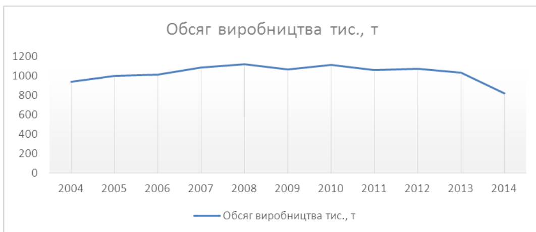
Рис. 1. Динаміка виробництва кондитерської продукції в Україні у 2004-2014 рр., тис. т (джерело: побудовано на основі [1])

Виклад основного матеріалу дослідження. До недавнього часу ринок кондитерських виробів інтенсивно розвивався. Проте період 2013-2014 рр. ознаменувався для кондитерської галузі тенденцією до падіння та входження у кризові процеси (рис. 1).