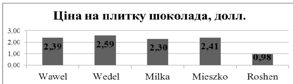
Рис. 3. Порівняння середніх цін на плитку шоколаду в Польщі, дол.

Починаючи з 2006 року кондитерська корпорація «ROSHEN» виробляє продукцію у Литві. Купівля даної фабрики допомагає корпорації «ROSHEN» просувати свою продукцію на ринках країн ЄС і пов'язана з прагненням «ROSHEN» закріпитися в балтійських країнах. Виробничі потужності розташовані у місті Клайпеда. Виробництво спеціалізується на широкому асортименті карамельної продукції. «ROSHEN» інвестувала в Клайпедську кондитерську фабрику UAB «ROSHEN» суму біля 8 млн євро. Інвестиції використані для закупівлі та встановлення нових потужних ліній для випуску карамельної продукції, а також на збільшення ефективності енергетичного господарства фабрики. Після модернізації планова виробнича потужність фабрики збільшена до 1290 тонн на місяць. Продукція з литовської фабрики почала надходити на полиці ЄС з березня 2011 року [2]. «ROSHEN» стала першою українською кондитерською компанією, яка представила свою продукцію на «батьківщині» шоколаду – у Швейцарії. У 2015 р. корпорація «ROSHEN» відкрила дочірню компанію в Польщі. У Варшаві почав працювати офіс «ROSHEN» Еугоре – дочірньої компанії української кондитерської. Протягом п'яти років корпорація «ROSHEN» хоче стати одним із найбільших гравців на польському ринку, корпорація стежить, як працюють Wawel, Wedel, Milka і Mieszko в Польщі. Перевагою продукції «ROSHEN» Еугоре може стати нижча ціна продукції, ніж у конкурентів [3].