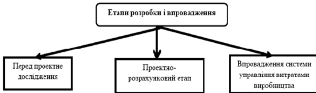
Рис. 3. Послідовність розробки і впровадження ефективної системи управління витратами виробництва

В сучасних умовах практично кожне підприємство повинно самостійно вирішувати питання стосовно управління витратами виробництва, визначати вимоги до ефективності їх здійснення тощо. Однак в усіх випадках має ставитись мета управління витратами виробництва і розроблятися завдання та заходи її реалізації. На основі вивчення теоретичних матеріалів і результатів діяльності провідних підприємств, на рис. 3 показана послідовність організації робіт, пов'язаних із формуванням вимог до управління витратами виробництва, розробкою і впровадженням системи управління витратами на підприємстві.