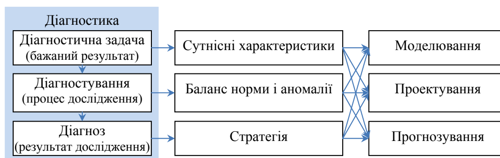
Рис. 1. Структура і алгоритм діагностики ([11] з уточненнями)

До того ж такому аналізу властива сукупність іманентних якостей (виділених у [11, с. 21] та уточнених за змістом), до яких належить: