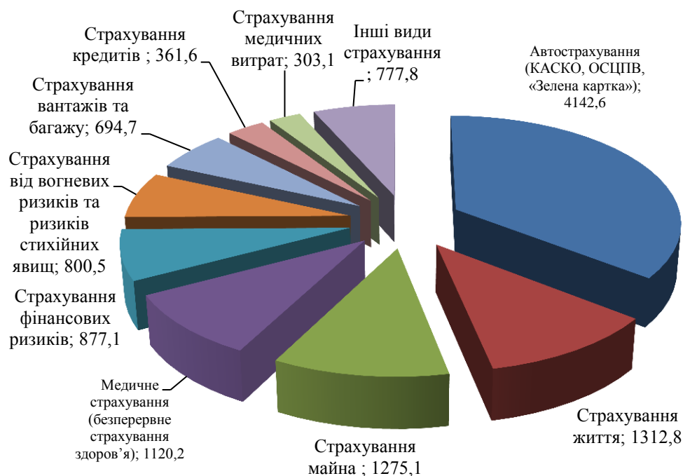
Рис. 4. Структура страхових премій за видами страхових послуг станом на 30.06.2016 (млн грн)

Джерело: побудовано автором за даними [8]