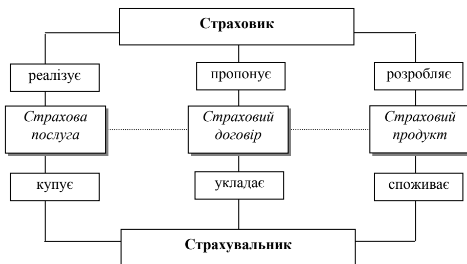
Рис. 2. Структура відносин між продавцем і покупцем у страхуванні [2, 4]

Сутність ринку страхових послуг виявляється в тому, що він призначений для укладання договорів між продавцем і покупцем страхового продукту, який пов'язаний із захистом майнового інтересу клієнта від збитку, внаслідок настання страхового випадку. Надання страхової послуги є основною метою діяльності страхових компаній: при реалізації страхових послуг, укладанні страхових договорів, продаються страхові поліси, отже, запропоновані страховиком страхові продукти характеризуються попитом і зацікавленістю на певний вид послуги у страхувальника (рис. 2).