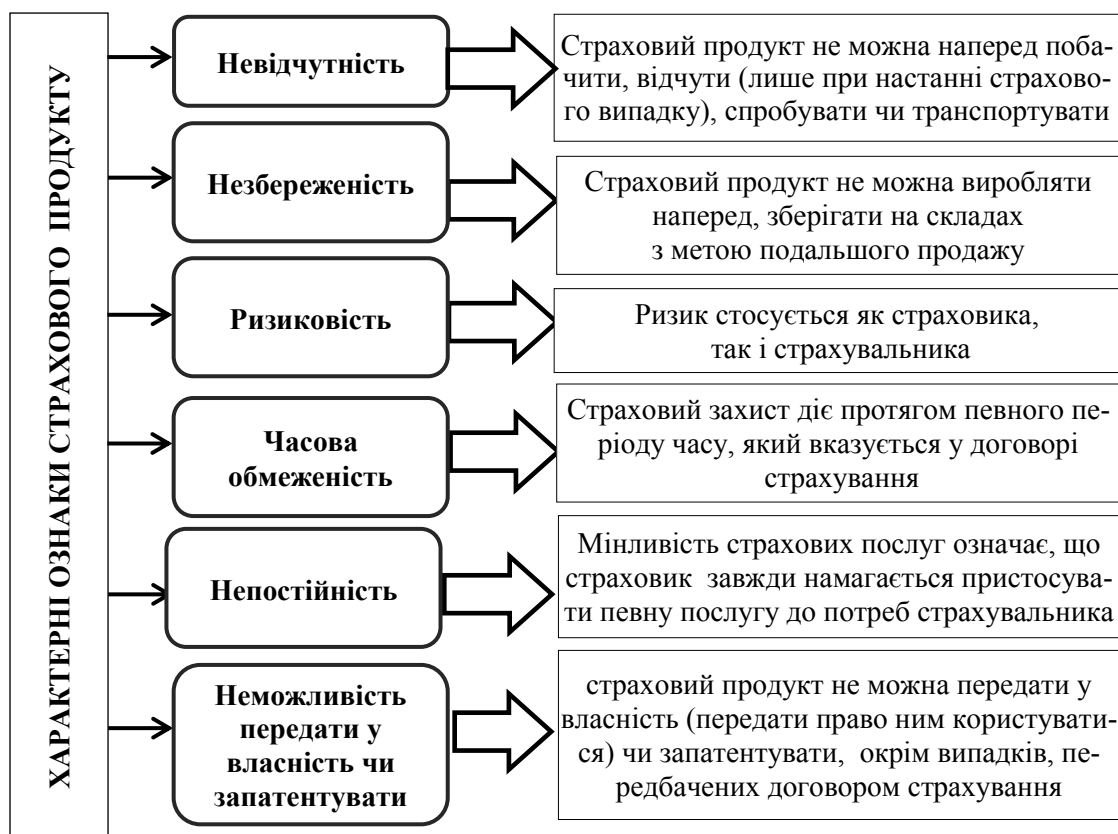
Рис. 1. Характерні ознаки страхового продукту

Характерні ознаки страхового продукту наведено на рис. 1.