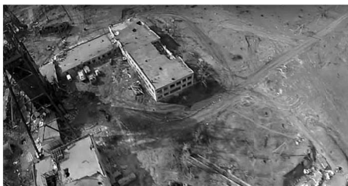
Рис. 4. Використання оператора Лапласа для покращення зображення шляхом віднімання відфільтрованого зображення Z3 із вихідного Z2

w = fspecial('laplacian', 0); w = [0 1 0; 1 -4 1; 0 1 0]; Z1 = imfilter(Z, w, 'replicate'); imshow(Z1, [ ]) Z2 = im2double(Z); Z3 = imfilter(Z2, w, 'replicate'); imshow(Z3, [ ]) Z4 = Z2 - Z3; imshow(Z4)