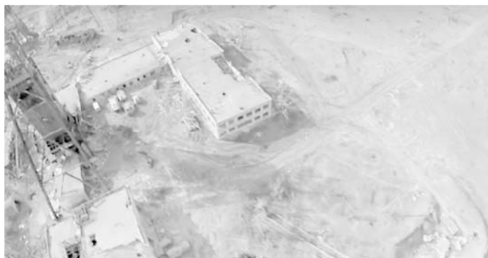
Рис. 2. Результат використання логарифмічного перетворення до півтонового зображення Z

Видозмінення гистограми. До другої групи методів покращення зображень в просторовій області відносяться такі перетворення як еквалізація гистограми.