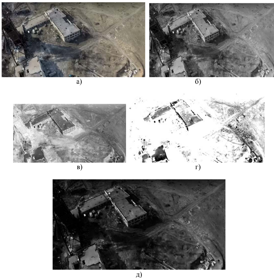
Рис. 1. Результати лінійних перетворень: а) вхідне кольорове зображення; б) півтонове зображення; в) негатив півтонового зображення; г) результат розширення інтенсивності із інтервалу [0.5, 0.75]; д) покращене зображення при \gamma=2

Логарифмічне перетворення. Логарифмічні перетворення застосовуються для розтягування діапазону значень темних пікселів на зображенні з одночасним стисненням діапазону значень яскравих пікселів. Дані перетворення описуються виразом: