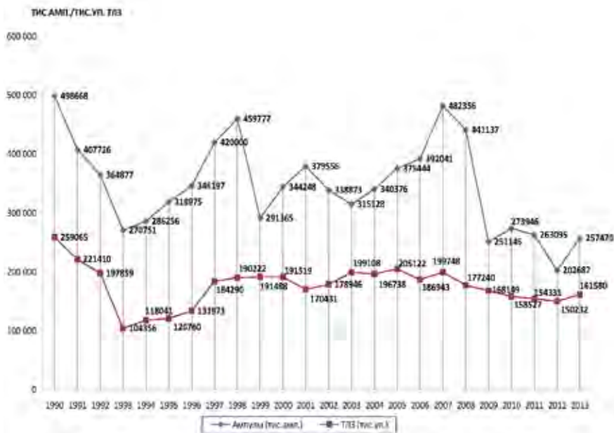
Рис. 2. Ретроспективний аналіз динаміки випуску товарної продукції та сучасний стан виробництва лікарських засобів на ПрАТ "Фармацевтична фірма "Дарниця" в натуральних показниках (тис.ампл., тис. уп.) за 1990-2013 рр.

Як видно з рис. 2 обсяги виробництва лікарських засобів у натуральних (кількісних) показниках та їх динаміка розвитку чітко демонструє, як у числових значеннях показників, так і у графічному вигляді, кризові економічні злами з початку розвитку й становлення Незалежної України. Так, випуск ампульної продукції у 1993 році у порівнянні з 1990 р. знизився у 1,84 рази. Показник падіння обсягів випуску таблетованих лікарських засобів за аналогічний період, скоротився у 2,5 рази (2,48). Цей період набув кризових розмірів в економіці держави, тотальної руйнації, закриття багатьох промислових підприємств.