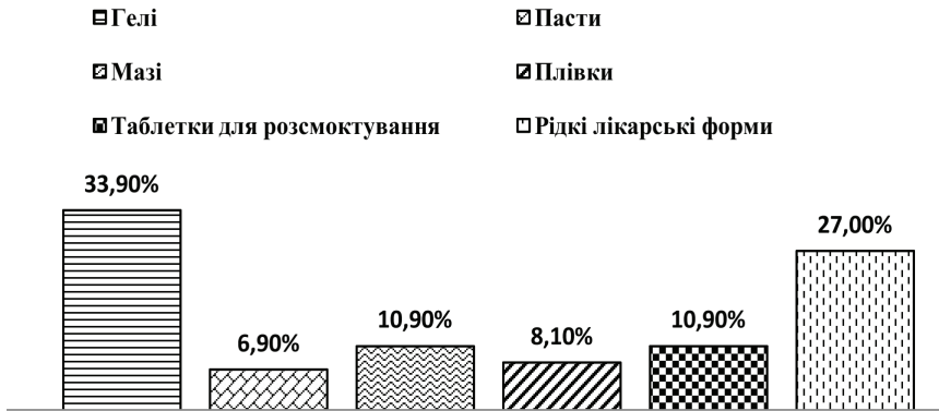
Рис. 1. Розподіл ЛП, що застосовують лікарі-стоматологи, за лікарськими формами

Головною метою даного блока анкети було визначення лікарських форм, які лікарі радять застосовувати при захворюваннях стоматологічного профілю. Результати опитування візуалізовані на рис. 1.