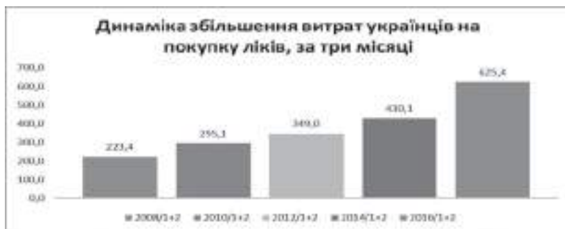
Рис. 3. Аналіз витрат українців на закупівлю ліків

Також на якість ЛЗ на етапах медичного застосування впливає і цінова політика, яка має тенденцію до росту. Аналіз даних компанії KANTAR TNS за останні роки (аналізувались вибрані три місяці) показав, що особисті витрати українців на закупівлю ліків збільшуються в середньому таким чином: 2008 р. – 223,4 грн.; 2010 р. – 295,1 грн.; 2012 р. – 349,0 грн.; 2014 р. — 430,1 грн.; 2016р. – 625,4 грн., відповідно (рис. 3).