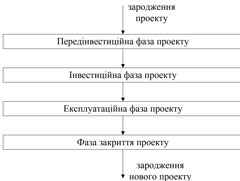
Рис. 3. Схема поділу життєвого циклу проекту на фази [4]

Поєднавши проаналізовані підходи до життєвого циклу проекту (рис. 1, 3) можна зробити висновок, що в одному з них подаються загальновизнані фази проектування, а в іншому розглядаються види робіт, які забезпечують ці фази. Все перераховане вище можна подати у вигляді таблиці.