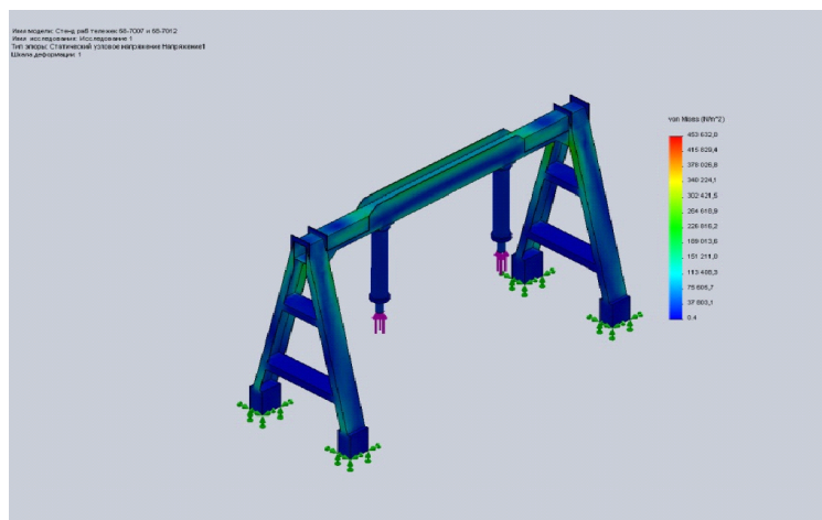
Рис. 4. Поля напружень у несучій конструкції стенда