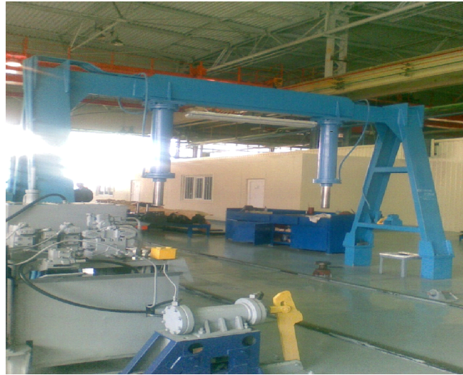
Рис. 2. Стенд для розбирання (складання) візків моделей 68-7007 і 68-7012(13)