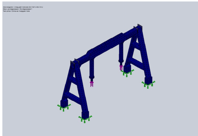
Рис. 3. КЕМ та розрахункова схема стенда