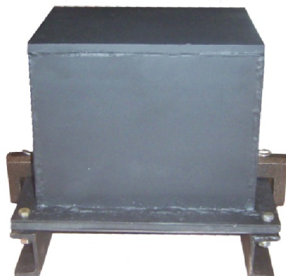
Рис. 1. Розроблений навігаційний пристрій GPS вантажного вагона