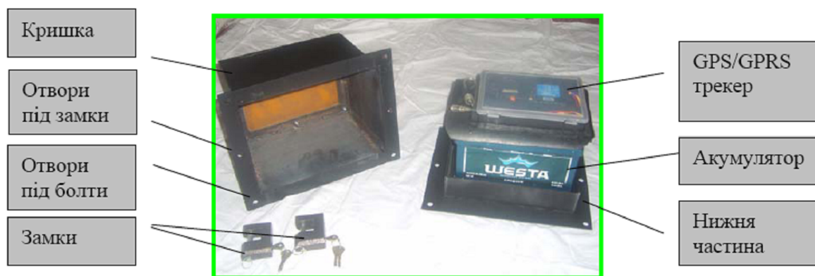
Рис. 2. Елементна база навігаційного пристрою GPS

Для енергозабезпечення бортового навігаційного обладнання, систем керування, безпеки, діагностики та контролю пристрій має автономне джерело електричної енергії, оскільки вантажні вагони за своєю конструкцією його не мають. Контролер обладнаний схемою захисту від підвищеної напруги живлення, яка автоматично формує звіти під час відсутності живлення. До складу контролера входить SIM карта оператора з PIN кодом, який задається на етапі конфігурації для роботи в GSM мережі. Дана система має надійно працювати в автономному режимі у термін 6 місяців без зовнішньої підзарядки або заміни акумуляторної батареї.