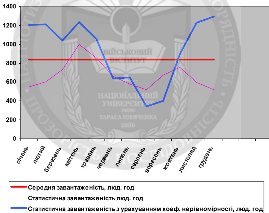
Рис. 2. Графіки розподілу статистичного, усередненого та статистичного з урахуванням нерівномірності розподілу потоку відмов, завантаження ПТОР

де L_i – обсяг витраченого (запланованого) ресурсу в i -тому місяці; L_{\text{сеп}} – середньомісячний обсяг ресурсу на календарний рік.