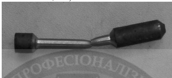
Рис. 2. Образец после проведения механических испытаний

Чтобы сравнить качество образцов из сплава ВНЛ-3 первой и второй серии опытов необходимо провести механические испытания лучших образцов на растяжение (рис. 2). Результаты испытаний указаны в таблицах 5, 6.