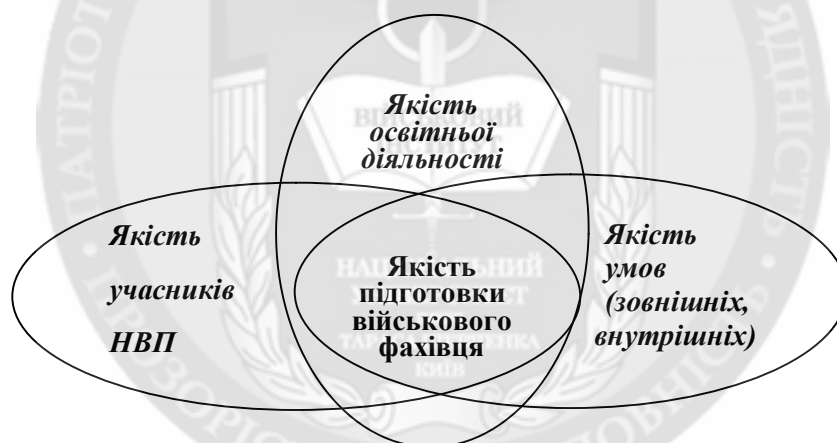
Рис. 2. Взаємозв'язок якості підготовки військових фахівців з основними складовими педагогічної системи ВВНЗ

Розглядаючи ПС як цілісне утворення (рис. 1), пильну увагу слід приділити найважливішій її складовій – якості підготовки військових фахівців, що є своєрідною похідною від якості учасників НВП, якості освітньої діяльності ВВНЗ та якості умов, в яких педагогічна система функціонує (рис. 2). Успішність функціонування ПС ВВНЗ може мати місце лише за умови організованого і скоординованого “запуску” всіх її взаємопов’язаних елементів, якість кожного з яких має підлягати моніторингу.