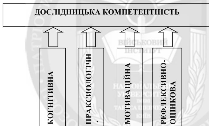
Рис. 1. Структура дослідницької компетентності наукових кадрів вищих навчальних закладів зі специфічними умовами навчання

Наведений вище підхід дозволяє більш повно, детально та коректно показати структуру дослідницької компетентності наукових кадрів ВНЗСУН, однак, він ще вимагає додаткових досліджень та апробацій. Тому на даному етапі досліджень прийнято обмежуватися включенням когнітивної, праксіологічної, мотиваційної та рефлексивно-оцінкової складових дослідницької компетентності (рис. 1).