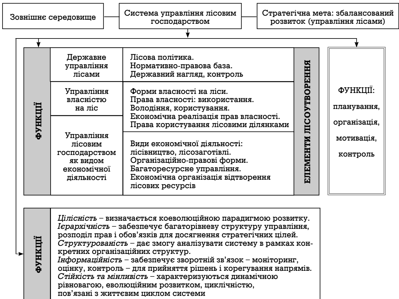
Рис. 2. Модель системи управління лісовим господарством

Структура системи лісоуправління охоплює наступні підсистеми: державне управління лісами, управління власністю на ліси, управління лісовим господарством як видом економічної діяльності відповідно до класифікатора видів економічної діяльності