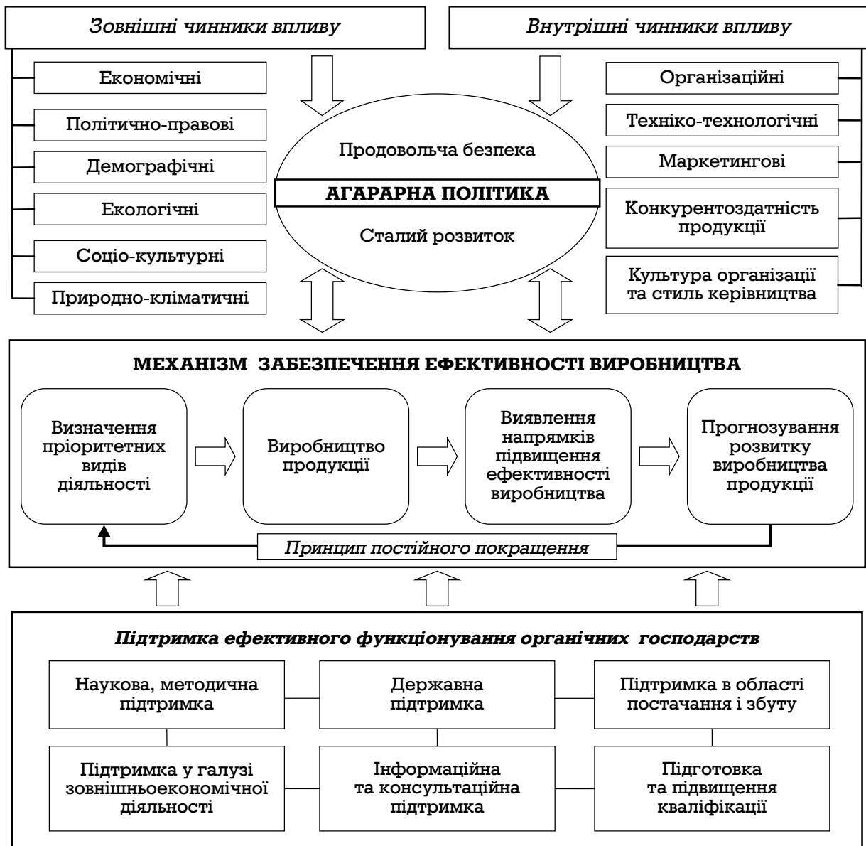
Рис. 1. Структурно-логічна схема організаційно-економічного забезпечення ефективного функціонування виробництва органічної сільськогосподарської продукції

тивного функціонування: державна підтримка, науково-методичне забезпечення, підтримка в сфері постачання і збуту, а також підготовка, перепідготовка та підвищення кваліфікації працівників (рис. 1).